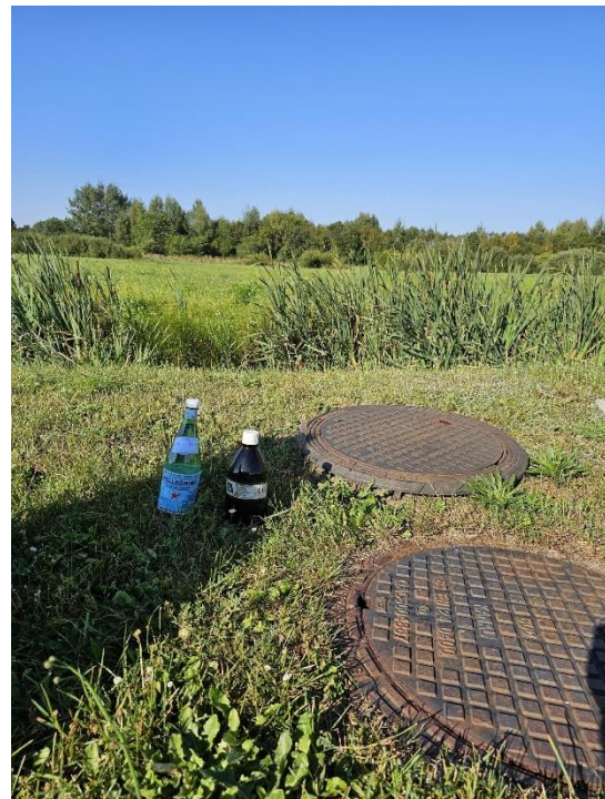
4. attēls. Skats uz aku, kurā izplūst NAI attīrītie sadzīves, un izplūstošo notekūdeņu paraugu ņemšanas vietu (27.08.2024.)