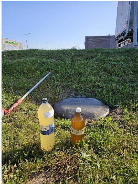
3.attēls. Skats uz sadzīves notekūdeņu attīrīšanas iekārtas iepļūdes aku un iepļūstošā sadzīves notekūdeņu paraugu noņemšanas vietu (27.08.2024.)

Parauga ņemšanas laikā tika piefiksēti laikapstākļi – 14.03.2024. laiks bija saulains, gaisa temperatūra sasniedza + 10,2 °C. 10.05.2024. laiks bija apmācies, bez nokrišņiem, gaisa temperatūra sasniedz + 9,7 °C. 27.08.2024. laiks bija saulains, gaisa temperatūra sasniedz + 18 °C.