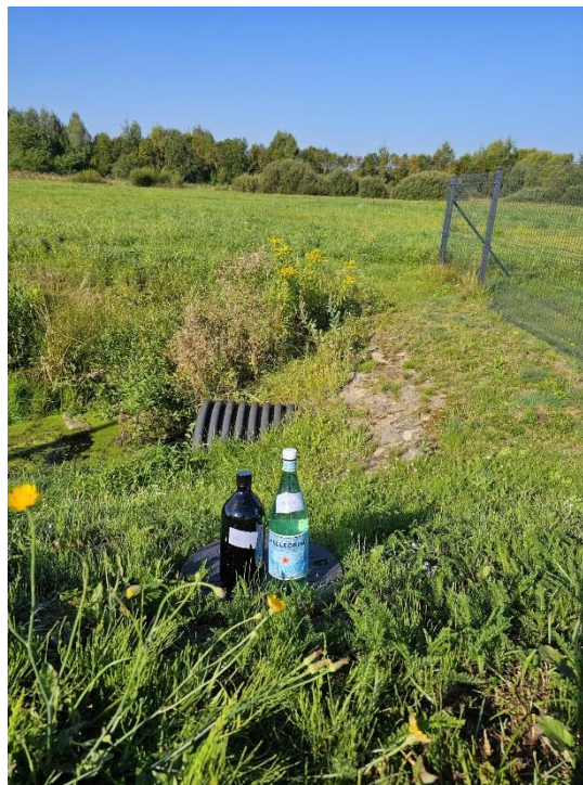
6. attēls. Skats uz aku, kurā izplūst NAI attīrītie ražošanas notekūdeņi, un izplūstošo notekūdeņu paraugu ņemšanas vietu (27.08.2024.)