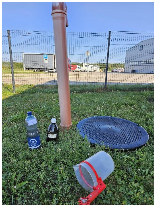
5.attēls. Skats uz ražošanas notekūdeņu attīrīšanas iekārtas ieplūdes aku un ieplūstošā ražošanas notekūdeņu paraugu ņemšanas vietu (27.08.2024.)