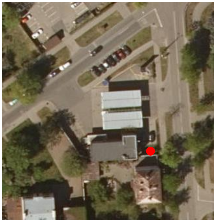
1. attēls. A/S „VIRŠI-A” DUS “Pērnavā” lietus notekūdeņu parauga ņemšanas vieta ●

Attīrītie lietus notekūdeņu paraugu ņemšanas vietu skatīt 1. attēlā.