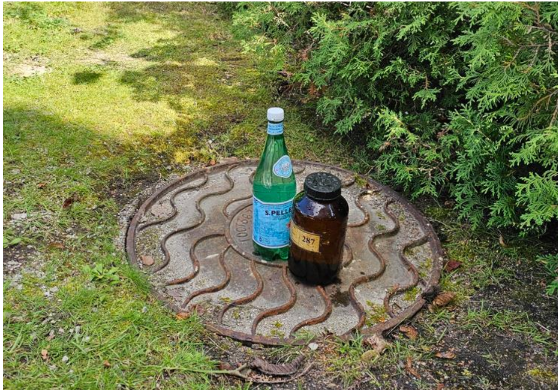
2.attēls. Paraugu noņemšana lietus notekūdeņu kanalizācijas akā (01.08.2024.)