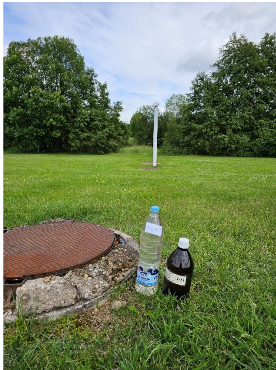
2.attēls. Skats uz kanalizācijas aku notekūdeņu attīrīšanas iekārtu izplūdē, kurā tika ņemts lietus notekūdeņu paraugs (02.07.2024.)

Parauga ņemšanas laikā tika piefiksēti laikapstākļi – 02.07.2024. bija saulains, gaisa temperatūra sasniedza +22,1 °C.