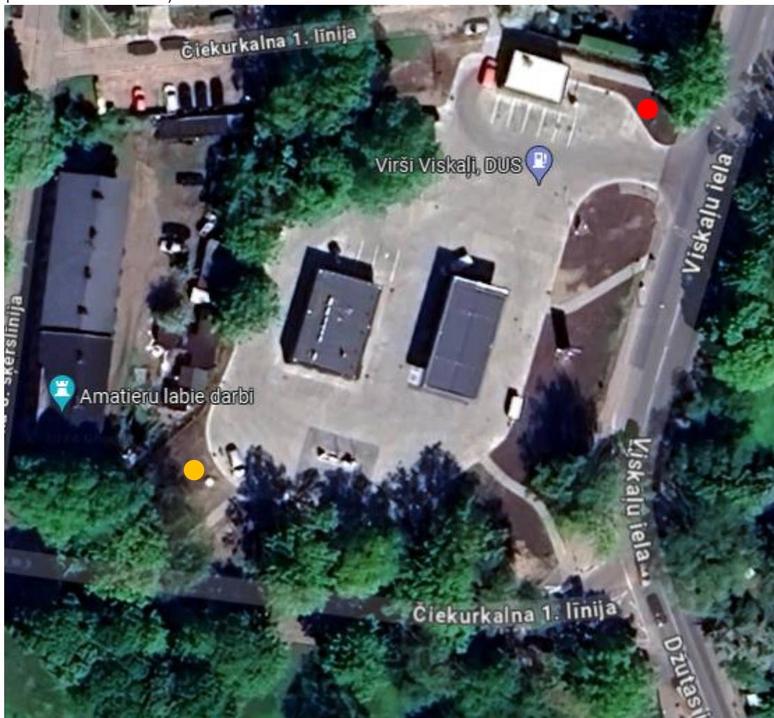
1. attēls. A/S „VIRŠI-A” DUS “Viskaļi” lietus notekūdeņu attīrīšanas iekārtu atrašanās vieta ● un attīrīto ūdeņu infiltrācijas lauks ●

Attīrītie lietus notekūdeņi tiek novadīti uz pilsētas kolektoru (NAI izvietojumu un notekūdeņu izplūdi skatīt 1. attēlā).