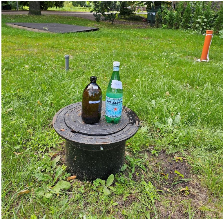
2.attēls. Paraugu ņemšana no pēdējās skatākas lietus notekūdens attīrīšanas iekārtas sistēmā pirms infiltrācijas laukiem (01.08.2024.)

Parauga ņemšanas laikā tika piefiksēti laikapstākļi – 01.08.2024. laiks bija saulains ar mākoņiem, gaisa temperatūra sasniedz +22,4°C.