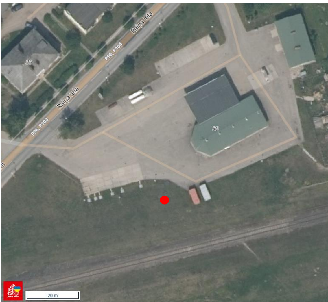
1. attēls. A/S „VIRŠI-A” DUS “Auce” parauga ņemšanas vieta

NAI izvietojumu un paraugu ņemšanas vietu skatīt 1. attēlā).