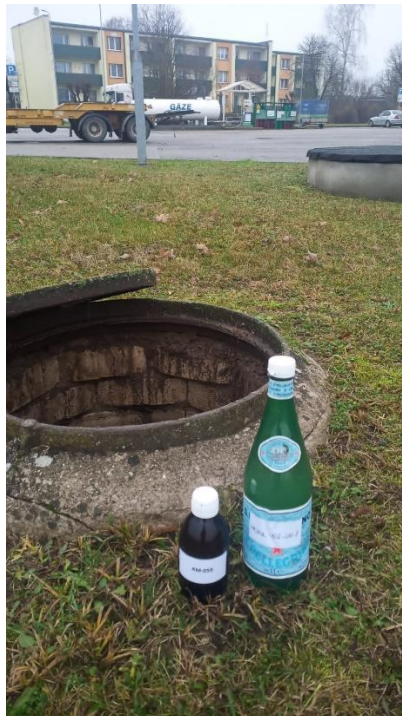
2.attēls. Skats uz notekūdens paraugiem un NAI paraugu ņemšanas aku (03.12.2024.)

Parauga ņemšanas laikā tika piefiksēti laika apstākļi – 03.12.2024. laiks bija apmācies, gaisa temperatūra sasniedza +6,1 °C.