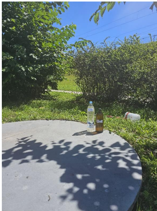
2.attēls. Skats uz paraugu ņemšanu notekūdeņu attīrīšanas iekārtu izplūdē (25.06.2024.)

Parauga ņemšanas laikā tika piefiksēti laika apstākļi – 25.06.2024. laiks bija saulains, gaisa temperatūra sasniedza +23,4 °C.