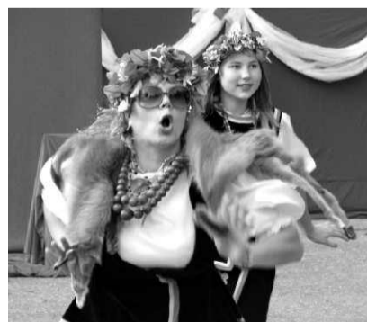
Ukrainas zelteņu priekšnesums

Pēc apsveikumiem sākās muzikāls uzvedums „Minhauzena dēku stāsti”, kuru caurvija Minhauzena ceļojums pa dažādām pasaules valstīm un ko izdejoja un izdziedāja Saulkrastu mākslinieciskie kolektīvi. Vislielāko skatītāju sajūsmu un ovācijas izpelnījās Ukrainas zelteņu un Ķīnas geišu priekšnesumi.