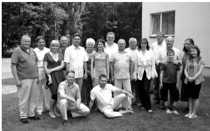
Saulkrastu un sadraudzības pašvaldību pārstāvji

Tikpat lieliskā noskaņojumā un vēl lielākā pulkā tiksimies nākamajos Saulkrastu svētkos!