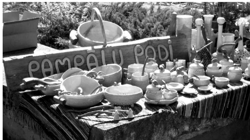
Amatnieku darinājumu un Latvijā ražotas produkcijas tirdziņš