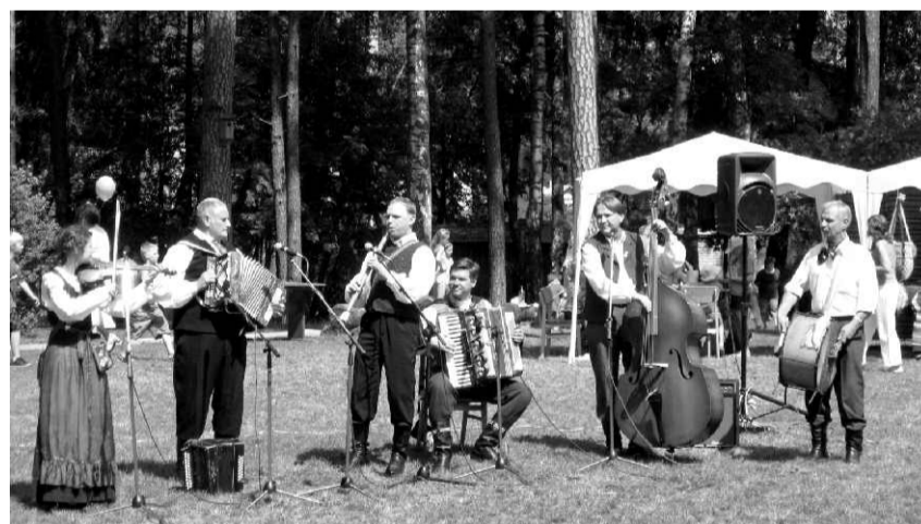
Lietuvas pilsētas Neringas kapella "Joldija"