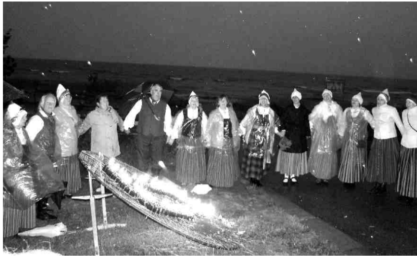
Baltu vienības dienas dalībnieki vienojas kopīgā uguns rituālā

Šīs dienas ietvaros kultūras namā „Zvejniekiems” norisinājās konkurss skolēniem „Es baltu tautu vidū”, ko organizēja pašvaldības aģentūra „Saulkrastu kultūras centrs”. Konkurss piedalījās Saulkrastu vidusskolas 8.klases komanda ar nosaukumu „Saulkrastu cilts” un Zvejniekiema vidusskolas 7a.klases un apvienotā 8.klašu komandas. Komandām bija sagatavoti vairāki uzdevumi, lai pārbaudīt skolēnu zināšanas par baltu valodām, kultūru, zīmēm, tradīcijām. Katra komanda bija veikusi mājas darbu – sagatavojusi prezentāciju par baltu tautām. „Saulkrastu cilts” prezentācija pārsteidza ar filozofisko ievirzi un muzikalitāti. Zvejniekiema vidusskolas 8.klašu prezentācijā sīki tika izklāstīta baltu izcelsme, tradīcijas, ēšanas paradumi un ģērbšanās tradīcijas. Zvejniekiema vidusskolas 7a.klase uzdevumu veica ar radošu pieeju – izmantojot zvejas tīklu un baltu kreklu, uz kura attēlotas baltu zīmes, tika vizualizētas baltu tautu tradīcijas un sadzīve.