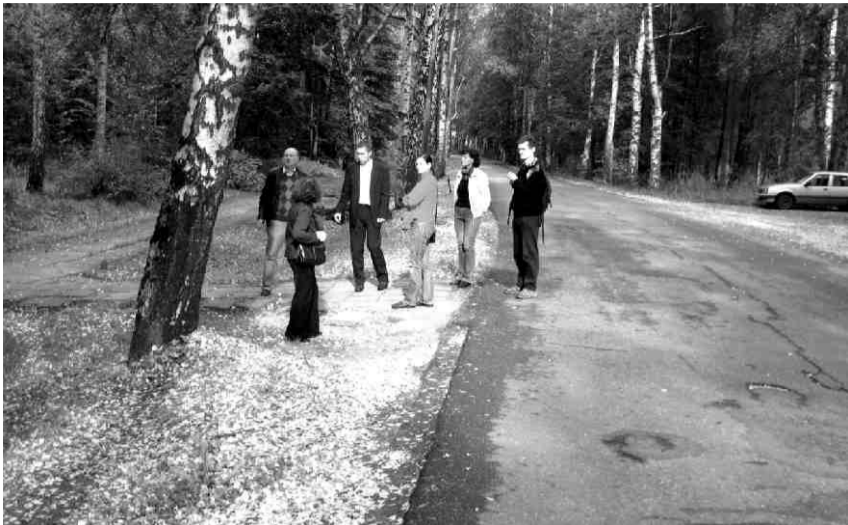
Projektu izvērtēšanas komisija A. Kalniņa ielas posmā pie Saulkrastu dzelzceļa stacijas