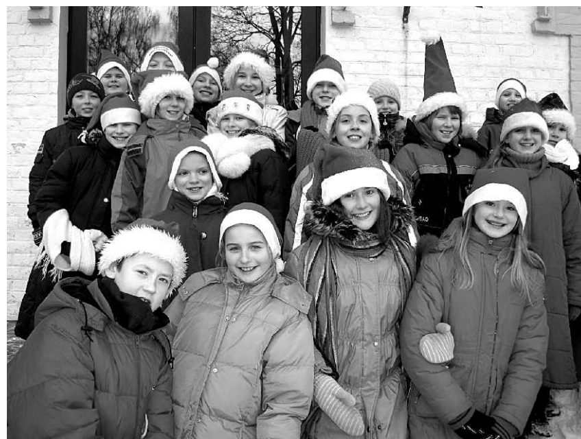
Čaklā rūku saime.