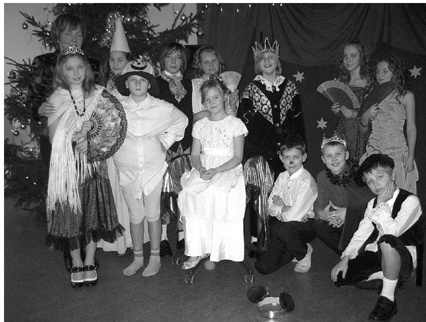
Uzveduma „Pelnušķīte” aktieri.

21.decembrī tika izdots Zvejniekciema vidusskolas avīzes „Medus un Pipari” 2009./2010.m.g. 2.numurs. No 14. līdz 21. decembrim notika Ziemassvētku pasākumi klasēs, kas neapšaubāmi ir sirsnīgi un ģimeniski, jo nereti notiek kopā ar vecākiem. 22.decembrī, pēdējā 1.semestra skolas dienā, sākumskolas skolēniem un viņu vecākiem bija iespējams noskatīties uzvedumu „Pelnušķīte”, kas piesaistīja uzmanību ar interesantu sižetu un aktieru meistariģo tēlojumu; savukārt pamatskolēni un vidusskolēni klausījās „Ziemassvētku pasaku pieaugušajiem”, kas rosināja padomāt par tādām patiesām un nezūdošām vērtībām kā