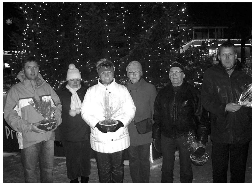
Noformējumu konkursa laureāti ar saņemtajām balvām.

Lai gan laika apstākļi nelutināja, 22.decembra vakarā, Saulkrastu iedzīvotāji bija pulcējušies uz Saulkrastu novada domes rīkoto Ziemassvētku pasākumu. Pasākuma laikā varēja mieloties ar gardu zirņu putru, iemalkot siltu tēju un pēc senām Saulgriežu tradīcijām minēt miklas un liet laimes. Tāpat pasākuma laikā notika veiksmīgāko Ziemassvētku noformējumu autoru sumināšana un apbalvošana. Jau decembra sākumā, lai Saulkrastu novadā radītu īstu Ziemassvētku sajūtu, Saulkrastu novada dome aicināja pašvaldības iedzīvotājus, uzņēmējus un iestādes iesaistīties konkursā par novada izrotāšanu. Apzinot Ziemassvētkiem atbilstoši izrotātos objektus tika izvirzīti vairāki kandidāti. Izvērtējot svētku rotājumus, par veiksmīgāko noformējumu sabiedriskajā sektorā atzīta