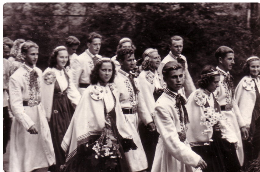
■ Gājiens uz Saulkrastu parku Dziesmu svētkos.

Bet gada vidū par pārsteigumu parūpējās zvejnieki: viņi no stāvvadiem izcēla 2 roņus. Tos