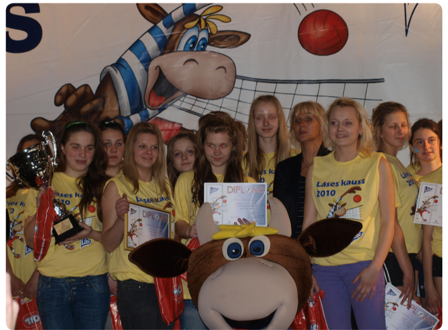
■ „Lāses kausa” uzvarētājas.

24.aprīlī Rīgā, Olimpiskajā „Skonto” hallē, noslēdzās „Lāse-2010” kausa izcīņas 9. finālsacensības vispārīglobošo skolu komandām, kuras organizēja Latvijas Volejbola federācija sadarbībā ar akciju sabiedrību „Rīgas piena kombināts” un Rīgas Domi.