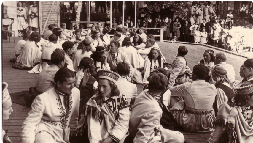
■ Dziesmu svētki 1954.gadā Saulkrastos.