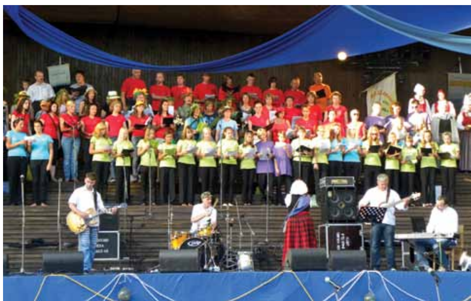
Kopkoris noslēguma koncertā.

Izskanējuši Saulkrastu svētki 2010, kas norisinājās no 2. līdz 4. jūlijam. Šogad svētku devīze skanēja – Upes plūst un satiekas jūrā, ļaudis satiekas Saulkrastos! Redzot, cik apmeklāti bija Saulkrastu svētku laikā notikušie pasākumi, tik tiešām, ļaudis satikās Saulkrastos. Šogad godā tika celtas četras novada upes, kuras attēlotas Saulkrastu novada ģerbonī – Inčupe, Pēterupe, Ķīšupe un Aģe. Pie katras no tām notika dažādi pasākumi, tā atceroties un godinot upi.