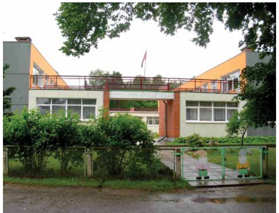
Bērnodārza renovētā fasāde.