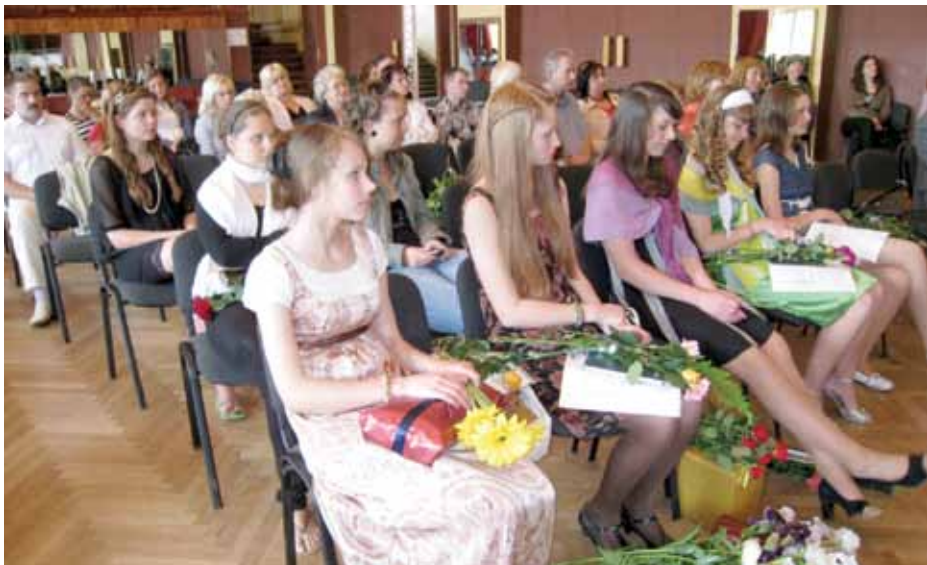
VJMMS vizuāli plastiskās mākslas nodaļas audzēknes izlaiduma laikā.