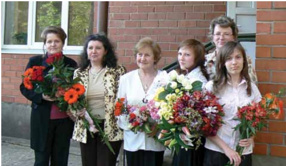
VJMMS audzēknes un skolotājas.