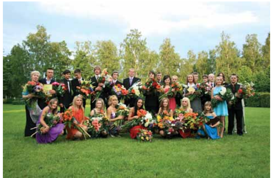
2010. gada Zvejniekiema vidusskolas absolventi un pedagogi.

Savukārt 12. klases 27 skolēni atvadas skolai teica 18. jūnijā. Viņiem gan līdz apliecību un sertifikātu saņemšanai vēl jāgaida, jo rezultāti būs zināmi tikai 15. jūlijā.