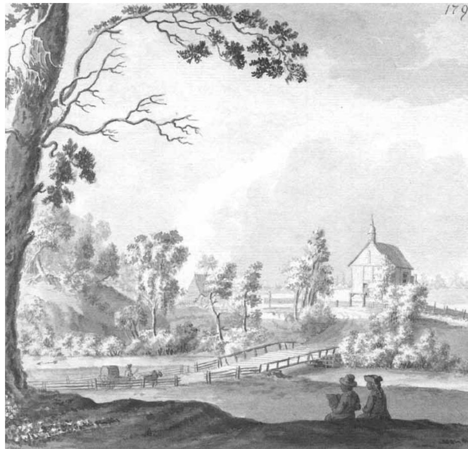
Peterskapelle 1794 gads. J. Broces zīmējums.

Pēterupes draudzē no 1660. ( pirms 350 aa-