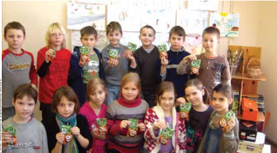
Programmas “Skolas auglis” dalībnieki

Janvārī Saulkrastu vidusskola uzsāka darbību Eiropas Komisijas finansētajā programmā “Skolas auglis”, kas paredz iespēju 1.–6. klašu skolēniem ik dienas ārpus ierastajām ēdienreizēm bez maksas mieloties ar svaigiem dārzeņiem un augļiem. Programma ilgs divus mēnešus.