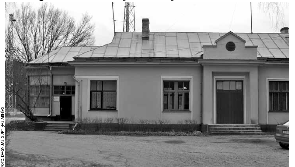
Autostacijas ēka mūsdienās

(Turpinājums. Sākums "Saulkrastu Domes Ziņu" 2010. gada decembra numurā.)