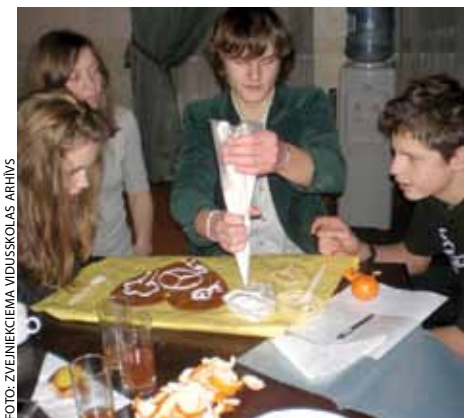
Zvejniekciema vidusskolas komanda “Čaklie”

Lai iekļūtu konkursa finālā, mēs meklējām informāciju par šo uzņēmumu, ieskatoties tā vietnē, un intervējām darbiniekus. Mums vajadzēja noskaidrot, kā ražotnē taupa elektroenerģiju un ūdeni, kādu transportu cilvēki izmanto, lai nokļūtu darbā. Pētījām uzņēmuma produkcijas daudzveidību, ražošanas procesus, to ietekmi uz