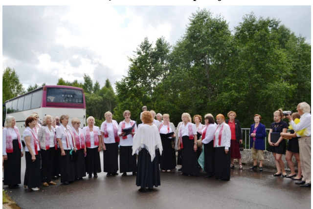
Dzied koris „Daugavas Vanadzies”