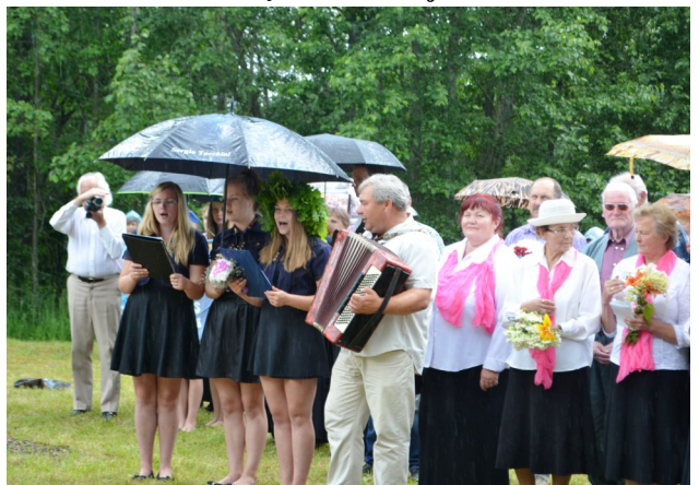
Līdumnieku meiteņu ansamblis izpildīja 2 dziesmas.