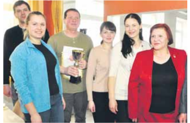
Команда Управления образованию заняла третье место

21 марта в Свентской средней школе прошел 5-ый Праздник спорта и отдыха учителей Даугавпилсского края, на котором педагоги могли посоревноваться в различных интересных дисциплинах и видах спорта, защищая честь школы. Команды краевых учителей соревновались в 10 дисциплинах: по баскетбольным броскам мяча в корзину, в аттракции «Хромающая команда», по броскам по мячу, в игре «Поймай мяч», по броскам по фризби, в директорском троеборье, по броскам в цель и в проверке «Осьминог».