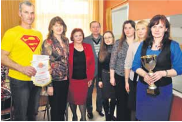
Обладатели первого места - команда Калупской основной школы