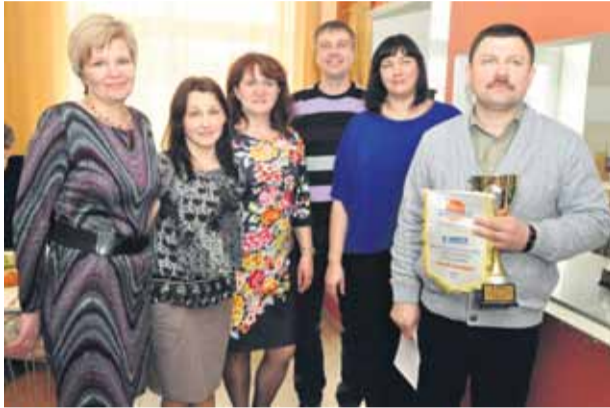
Серебряный призёр - команда Лачской основной школы