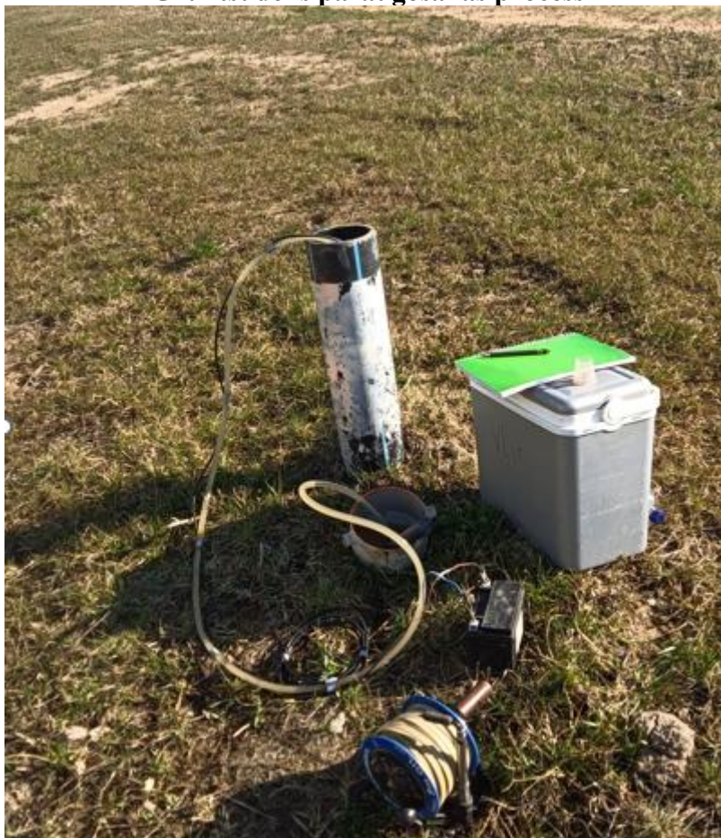
3. ATTĒLS

Pazemes ūdens paraugu laboratorijas analīžu rezultāti sniegti 4. tabulā, bet testēšanas pārskata kopijas atrodamas 2. pielikumā. Atbilstoši MK noteikumiem Nr. 118 10. pielikuma “Noteikumi