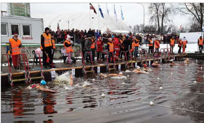
2012. gada pasaules čempionāts ziemas peldēšanā notika Latvijā, Jūrmalā, un to rīkoja klubs «Jelgavas roņi». Sacensībās piedalījās 1128 dalībnieki no 27 valstīm, un tika aizvadīti vairāk nekā 2000 peldējumi. Jelgavu pārstāvēja ap 60 roņi, kuri kopā izcīnīja 13 no Latvijas 22 medaļām.

Stāstot par organizatorisko pusi, A.Jakovļevs norāda, ka ļoti būtiski ir tas, ka kluba peldētāji piedalījušies visos čempionātos un daudzos jautājumos zinājuši, ko un kā darīt. Kopumā tika iesaistīti 40 kluba biedri, vēl ap 60 brīvprātīgo un,