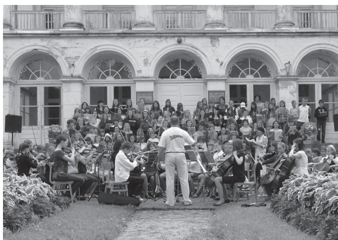
Jaunie mākslinieki vasaras nometnē Gaujienā, lasiet 7.lpp.

„Draugi un radi ir kā zvaigznes, ne vienmēr redzami, bet zinām, ka ir” – Krimuldas novadā notika Ancānu dzimtas un Kūriņu dzimtas salidojumi. Latvijas lepnums un spēks – lasiet 4.,5.lpp.