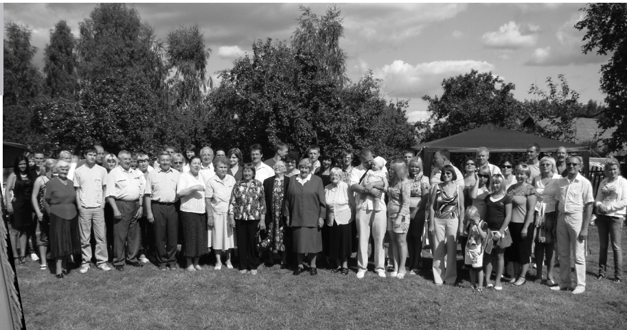
Ancānu dzimtas karogs