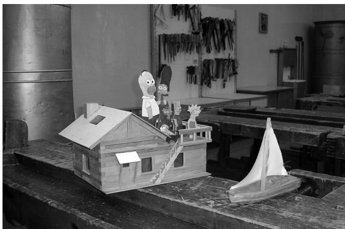
Lēdurgas pamatskolā, devīto klasi beidzot, ir jāpaveic lielāki darbi, kā, piemēram, jādarina māja ar visu iekārtojumu. Vispirms top rasējums un tikai tad praktiskais darbs

Skolā strādāju zēnu mājturības apmācības programmas ietvaros, kur arī ir iekļauta ēst gatavošana. Jāsaka, ka zēni