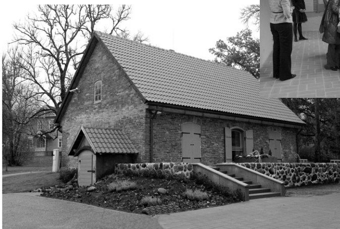
Apmeklētāju centrs no ārpusē un iekšpusē