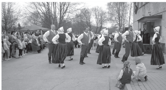
Vidējās paaudzes deju kolektīvs „Dzirnakmeņi”