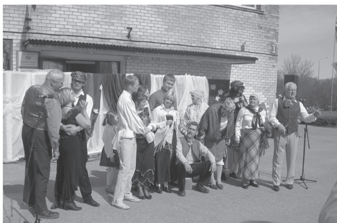
„Īsa pamācība milēšanā” un... patriotismā no amatiereteātra „Sprigulī”