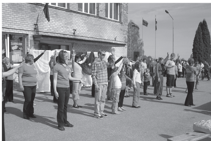
Līnīdzejotāji sadanco kopā ar skatītājiem