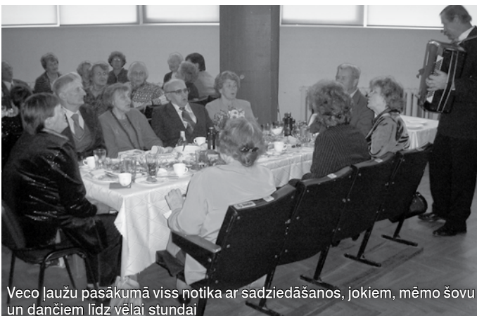
Veco ļaužu pasākumā viss notika ar sadziedāšanos, jokiem, mēmo šovu un dančiem līdz vēlai stundai