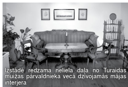
Izstādē redzama neliela daļa no Turaidas muižas pārvaldnieka vecā dzīvojamās mājas interjera