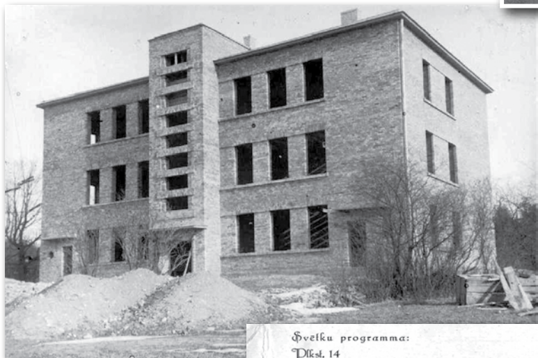
1934.g. 22.augustā tika likts pamatakmens jaunai skolas ēkai un jau 1935.g. 15.decembrī skola jau tika iesvētīta