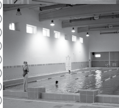
Laipni aicināti Krimuldas peldbaseinā!

13. novembrī mājīgajā krodziņā „Raganas ligzda” risinājās tradicionālais ZOLĪTES TURNĪRS.