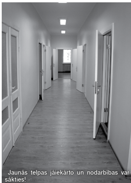
Jaunās telpas jāiekārto un nodarbības var sākties!

P.S. Krimuldas Mūzikas un Mākslas skolas orķestris godam pelnījis jaunas telpas, jo jau no septembra aktīvi koncertējis un mēģinājis kopā ar citu pašvaldību mūziķiem. Kultūras norises 2010./2011. gada sezonā: Krimuldas vidusskolā, Lēdurgas pamatskolā, Cēsu 2.pamatskolā, Limbažu kultūras namā, Valmieras 5.vidusskolā, Kocēnu kultūras namā, Mazsalacas kultūras namā.