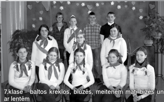
7.klase – baltos kreklos, blūzēs, meitenēm mati bizēs un ar lentēm

los, blūzēs, meitenēm mati sapīti kārtīgās bizēs un vēl iesietas lentes. Bija interesanti viņus vērot.