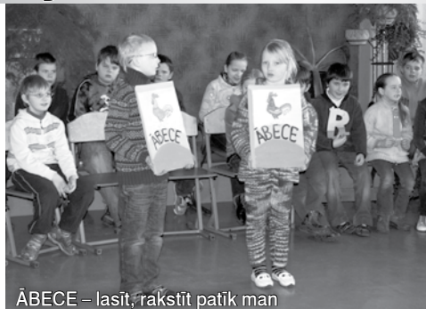
ABECE – lasīt, rakstīt patīk man

7.klase bija īpaši piestrādājuši – viņi demonstrēja ierindas skati. Patīkami bija tas, ka visi bija pienācīgi apģērbusies – baltos krek-