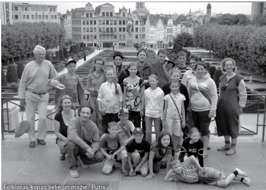
Folkloras kopas lielle un mazie „Putni”

18.jūnijs. Rīts atnāk ar pamatīgu vēju un lietu. Paldies „Putnu” pusaudžiem! Viņi jau