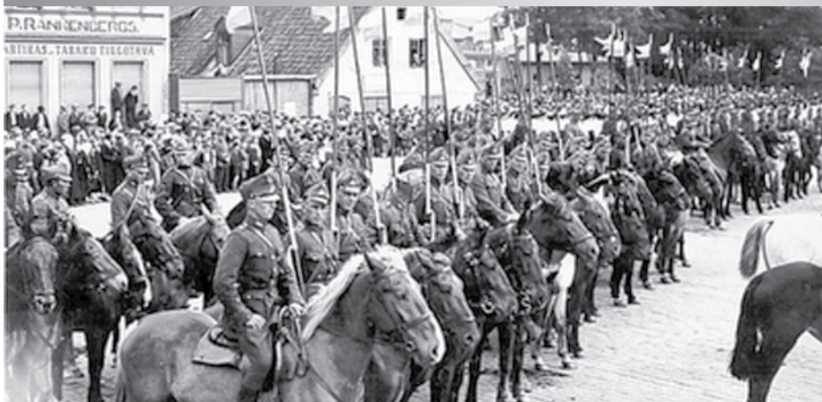
1921. g. jūlijā Aizsargu organizāciju reorganizēja: dienests vairs nebija obligāts, bet gan brīvprātīgs, aktīvo aizsargu skaitu ierobežoja līdz 50 personām katrā pagastā