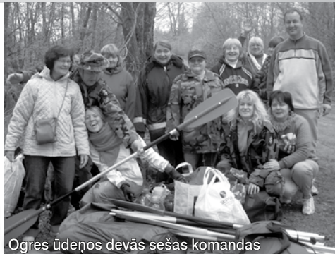
Ogres ūdeņos devās sešas komandas

Aiz muguras mācību gads-atbildīgs skolotājiem, bērniem, vecākiem. Skolēnisaņēmuši liecības, sākušās vasaras brīvdienas. Desmit 9.klases audzēkņi godam nokārtojuši eksāmenus un saņēmuši apliecinājumus par vispārējās pamatizglītības apguvi.