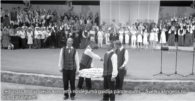
Lēdurgas 800 jubilejas koncerta noslēgumā gaidīja pārsteigums – Svētku kliņģeris no 800 gabalņiem!