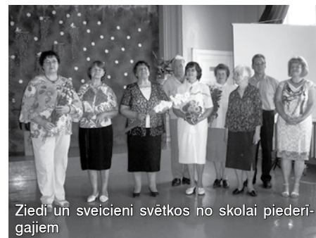
Ziedi un sveiciens svētkos no skolai piederīgajiem