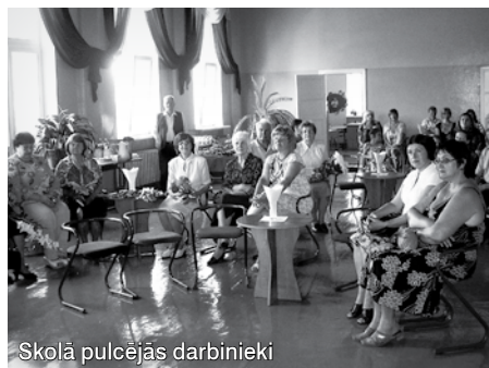
Skolā pulcējās darbinieki

Lēdurgas pamatskolas darbinieku saiets ir izskanējis, bet tajā gūtās pozitīvās emocijas saglabājušās. Jo attieksme skolā valda ik uz soļa. Pārkāpjot skolas sliekšni, svarīgākās lietas var uzzināt katrs Latvijas valsts pilsonis: Latvijas karogs, himnas vārdi, LV prezidenta, ministru prezidenta un Izglītības un zinātnes ministra vārdus, ziņas par Krimuldas novadu, domes deputātiem un novada izglītības iestādes, skolas himna un skolas izcilnieku saraksts. No šādi apkopotas informācijas rodas sapratne, piederības sajūta savam ciematam, rodas savas valsts patriotisms.