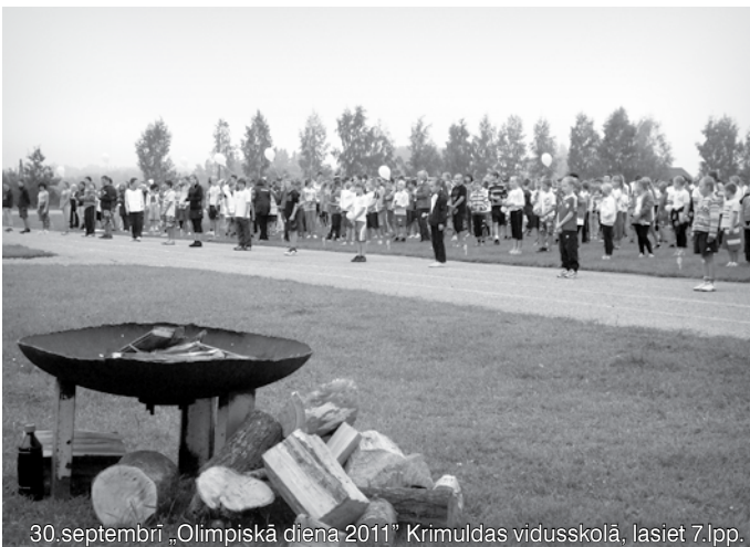
30.septembrī „Olimpiskā diena 2011” Krimuldas vidusskolā. lasiet 7.lpp.