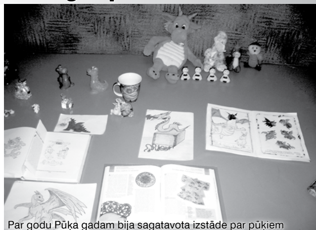
Par godu Pūķa gadam bija sagatavota izstāde par pūķiem

◆ Janvāra nogalē, 27.un 28.janvārī, Turaidas pamatskolā notika pasākums "Trokšņu un gaismas atpazīstamība tumšā diennakts laikā" . Piedalījās Turaidas un Lēdurgas skolas jaunsargi. Lelde