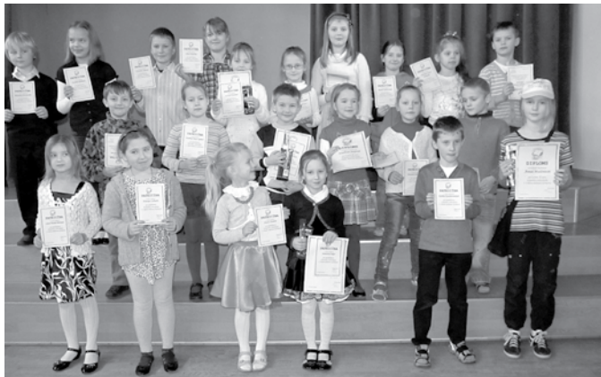
Daiļrunas konkursa dalībnieki