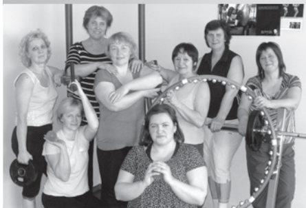
Dāmu klubiņa dalībnieces