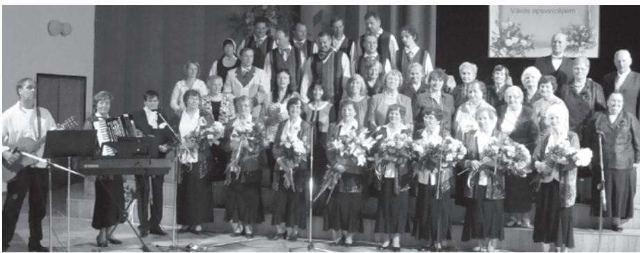
Gaviļnieki ar viesiem un Lēdurgas KN vidējās paaudzes deju kolektīva pārstāvjiem, kuriem bija jāpilda īpaša loma jubilejas pasākumā – vadīt un pat dancināt jubilārus