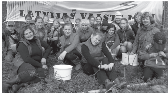
Jaunās priedītes iestādītas!

12.maijā, 4.-6.kl. skolēni brauca stādīt jaunās priedītes. Kopā ar vecākiem un skolotājiem bija kādi 30 dalībnieki, bet koku tika iestādīts daudz. Strādājām pa pāriem, jo bija speciāli stādāmie aparāti. Strādājām 2 stundas. Pēc stādīšanas visi gāja cept desīņas un našķoties, jo meža darbinieki bija sakļājuši bagātīgu galdu. Pēc paēšanas katrs dabūja dāvanīņu- atstarotāju. Kad visi brauca mājās, bija noguruši, bet patīkami pastrādājuši.