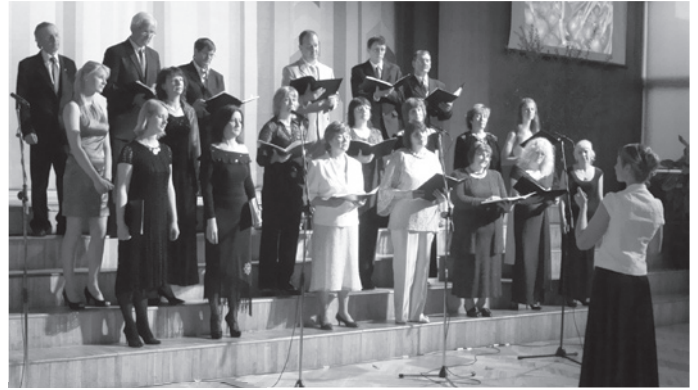
Paldies par ieguldīto darbu!