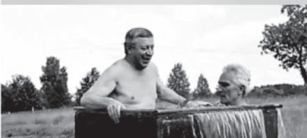
Kadrs no filmas

Filma “Raganu mēnesis” ir par diviem Latvijā pazīstamiem aktieriem, kuri vairs nevar tēlot, ka briedumā un pusmūžā ar dzīvi viss ir kārtība. Jo nav. Ir nopietna slimība, ir atkarības, un šīs dzīves krīzes atsedz faktu, ka abiem populāriem vīriem arī nav īstas skaidrības par savas dzīves jēgu un par to, kādēļ pēkšņi (vai arī pakāpeniski) daudz kas nogājis greizi.