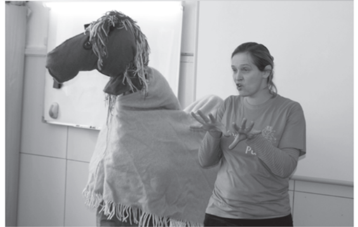
Masku tapšanas process interesants un radošs

las skolēni bija ekskursijā uz Rīgas piena kombinātu un Dabas muzeju, 8.klase pabija Kara muzejā, bet deviņi Siguldā. Skolotāji tradicionāli, jau 15.reizi, Skolotāju dienu atzīmē ar kopīgu ekskursiju. Šoreiz uz Piebalgas pusi, uz brāļu Kaudziņu un K.Skalbes dzimteni.