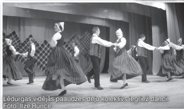
Lēdurgas vidējās paaudzes deju kolektīvs iegriezī danci.

Rubrikā „Pašdarbnieki rullē!” šoreiz uzzināsi Krimuldas tautas nama deju kolektīva „Dzirnakmeņi”, vadītāja A.Kalniņa, un Lēdurgas vidējās paaudzes deju kolektīva, vadītāja I.Luste, aktualitātes.