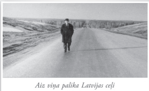
Aiz viņa palika Latvijas ceļi