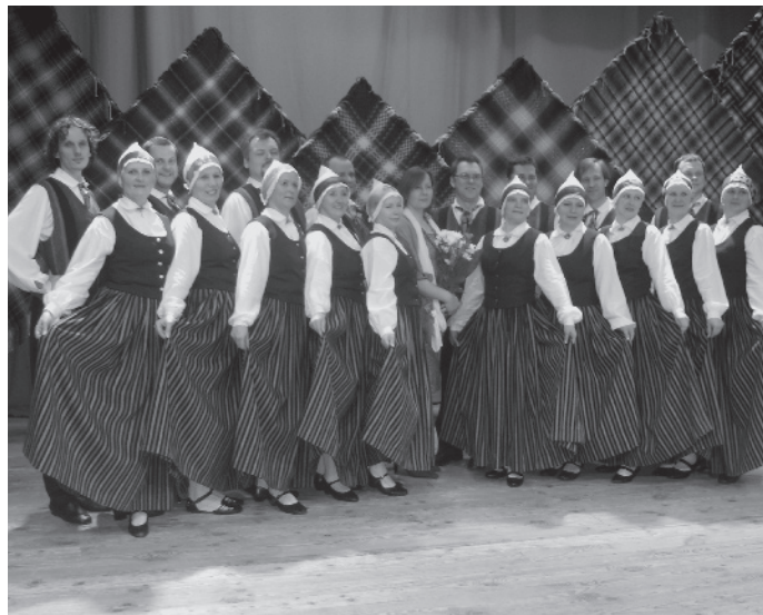
Lēdurgas kultūras nama vidējās paaudzes deju kolektīvs.

Dancotājus savā pulkā mēs gaidām katru gadu. Šobrīd būtu grūtāk iekļauties, bet septembrī, kad sākam jauno sezonu, interesenti var nākt. Atgādinu - gribēt dejojot un dejojot - ir divas dažādas lietas, taču nepameģinot neuzzināsi.