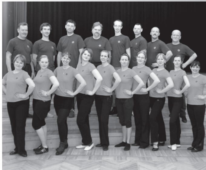
„Dzirnakmeņi” ar smaidu mēģinājumā speciāli novadniekiem

Grūtības pakāpe sastāv katrā dejojotāja attieksmē pret to, jo gribēt dejojot ir pilnīgi divas dažādas lietas. Pašam iet uz mēģinājumu un katrreiz pilnveidot kaut kādus soļus un prasmes, tas nav tik viegli - tur vajag lielu pacietību un īstenībā arī gribasspēku, jo ne vienmēr viss iznāk uzreiz. Mūsu kolektīvā dejo cilvēki, kas strādā maiņās, puīši: ugunsdzēsēji, apsargi, šoferi, taču maiņu darbi tiek sakārtoti, lai viss tiktu paspēts. Ir