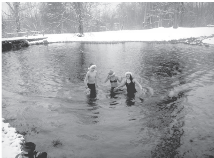
Ziemassvētki Allažu avotos.

Norises vieta: „Matīņa” ezers, Siguldas novads