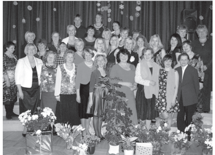
PII „Krimulda” kolektīvs: kādreizējie un tagadējie darbinieki

Kā izlēmāt PII „Krimulda” jubilejas pirmo daļu svinēt tik neierasti, ar diseni bērniem?