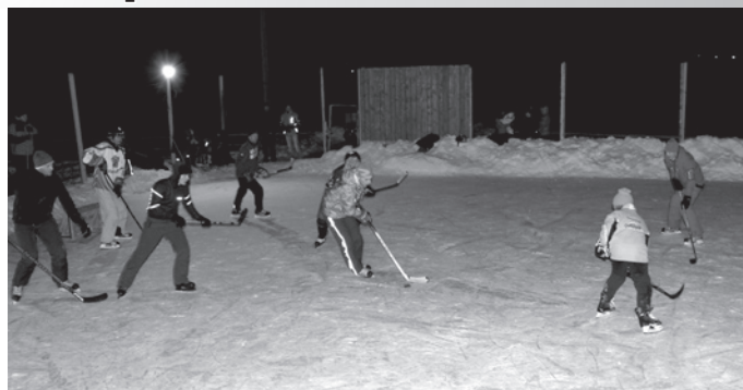
Izrādās daudziem patīk slidot un pat vēlās vakara stundās

Ar azartu hokeju spēlēja gan jauni, gan vecāki, gan tādi, kas sen nebija slidojuši un hokeju spēlējuši. Spēles laikā nedrīkstēja izmantot spēka paņēmienus, nedrīkstēja pārāk spēcīgi sist pa ripu. Vairāk vai mazāk tas arī tika ievērots, jo spēlētāji lielākā daļā spēlēja bez aizsargbruņām. Spēle norisinājās ļoti draudzīgā atmosfērā ar lielu ciņassparu. Sīvā ciņā ar rezultātu 35:31 tomēr viņnēja mājinieku - Raganas komanda. Rezultāts tik liels, jo spēlētas tika piecas piektdaļas un uz mazajiem vārtiem bez vārtsargiem.