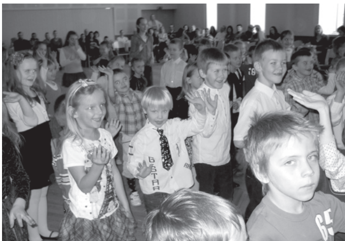
Disenītē jautrība sita augstu vilni

Jubilejas pasākums turpinājās ar deju vakaru un cienastu, mīlojamies ar dāvatājam tortēm un klinģeriem, SIA „Pansija” klātu galdu. Visi bija pacīlāti un priecīgi, ka pasākums izdevies.