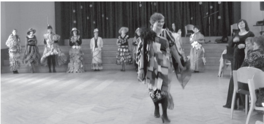
Izstādes dalībnieces bija sagatavojušas tērpus nepieradinātās modes gaisotnē