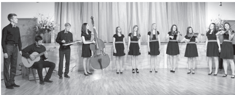
Parādot savu atraktivitāti, „Canto” izpelnījās žūrijas simpātijas