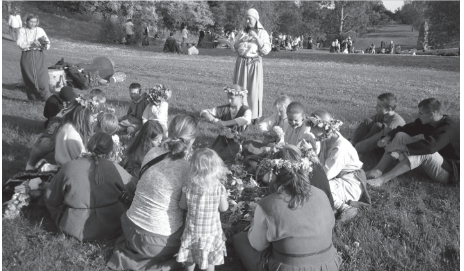
Folkloras kopa „Putni” Saulgriežos Turaidas Muzejrezervātā.

Un tomēr svarīgākais ir prieks saspēlēt, sadziedāt, sadancot un vienkārši būt kopā. Tas arī veikšanās pamats.