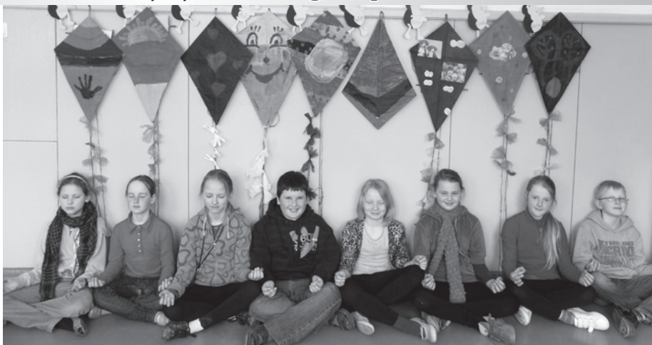
4. klase ar saviem pūķiem