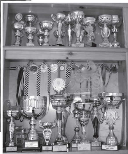
Iegūto kausu un medaļu klāsts iespaidīgs!