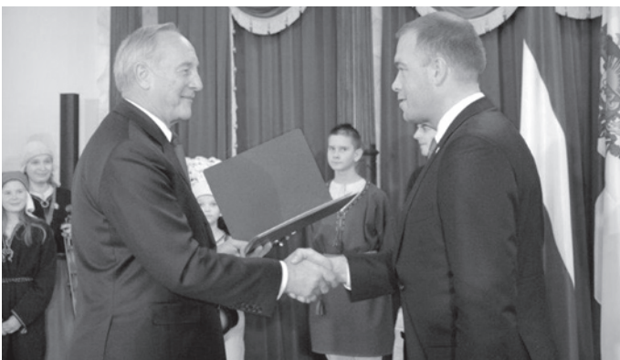
LV prezidents A.Bērziņš sveic Krimuldas novada domes priekšsēdētāju G.Grīnvaldu