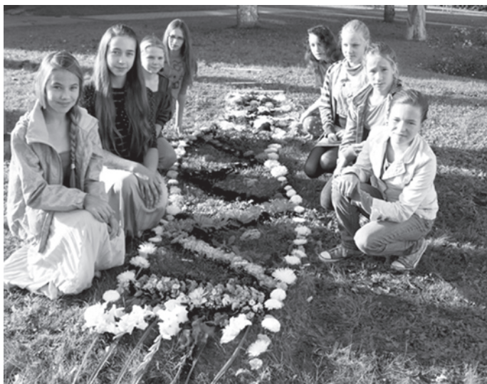
Rudens ziedu ceļš