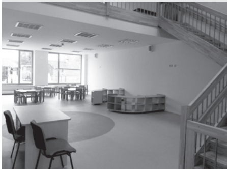
Notiek iekārtošanās darbi