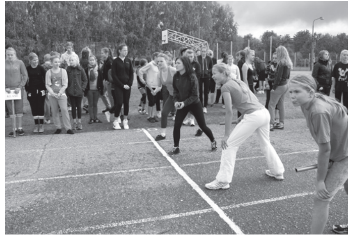
Tūlīt sāksies sacensības veiklības stafetē

Katrs sporta aktivitāšu dalībnieks saņēma Starptautiskās Olimpiskās komitejas un Latvijas Olimpiskās komitejas prezidentu parakstītu Olimpiskās dienas sertifikātu – diplomu. Katrai komandai diploms ar