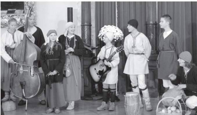
Uzstājas FK „Putni”