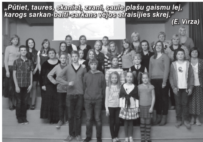
O.Vācieša dzejas konkursa 5.-12.kl.skolēni un skolotāji