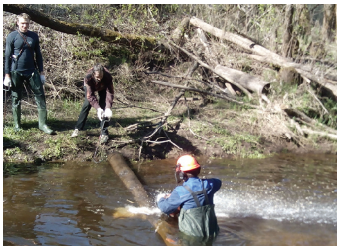
Lojas upes sakopšanas darbos diezgan daudz veicamā bija vīriem ar motorzāģi.

Kopumā pārāk lielu aktivitāti nevarēja novērot, viss notika lēnām. Es personīgi, kā privātās mājas īpašnieks uzturu kārtībā savas mājas un tuvāko apkārtni, tāpēc man diezgan absurdi šķiet iet un vākt citu mēslus. Taču sabiedrība ir tāda, ka jāveic vēl daudz izskaidrojošo darbu, lai beigtu mēslot, vai precīzāk izsakoties- neatstātu atkritumus, savāktu pēc sevis. Novadā skumji redzēt apmeklētāju nevērīgo attieksmi Turaidas kapos, kur atkritumu savākšanas kultūra redzami pieklibo. Šogad atīrījām tālāko kapu malu, parādot, ka tiek tīrīts, cerams, ka apmeklētāji tur nemetīs vairs atkritumus, bet gan tikai tam paredzētajās vietās. Esam sākuši preventīvo darbu, t.i. audzināšanas darbu, cerot uz rezultātiem. Ātri un uzreiz nekas nenotiek, taču esmu optimists un ceru, ka lēnām pie kārtības novadā nonāksim. Pašiem paraugs ir jārāda un arī skatīsimies līdzi, lai to ievēro citi.