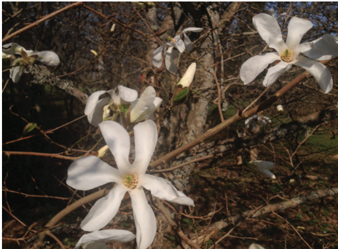
Lēdurgas Dendroparkā krāšņi uziedējušas baltās magnolijas.

Un tagad interesenti aicināti baudīt balto magnoliju skaistumu. Katru gadu tās no jauna priecē Dendroparka darbiniekus un apmeklētājus, atgādinot par to nenovērtējamo skaistumu.