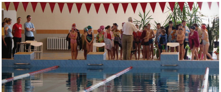
Vinnē tie, kas piedalās!

15. aprīlī sacentās 1.-6.klašu skolēni. Šeit šāds handikaps: 1.kl.- 6 sek., 2.kl.- 4 sek., 3.kl.- 3 sek., 4.kl.- 2 sek., 5.kl.- 1 sek., 6.kl.- 0 sek.