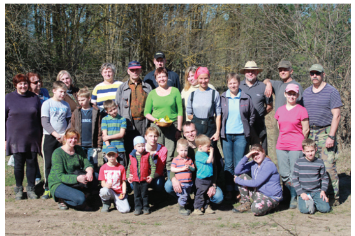
Talcinieku pulks pie Annas kalna

Annas kalns ir arī novadā pazīstama teiku un nostāstu vieta. Stāsta, ka kalnā ir nogrimusi baznīca. Tās zvani agrāk bijuši dzirdami vienos naktī, un tāpēc, lai nesabītos zirgi, vietējie centās pusnaktī kalnam garām nebraukt. Cits nostāsts vēsta, ka Annas kalna baznīcas zvans ierīpojis blakus