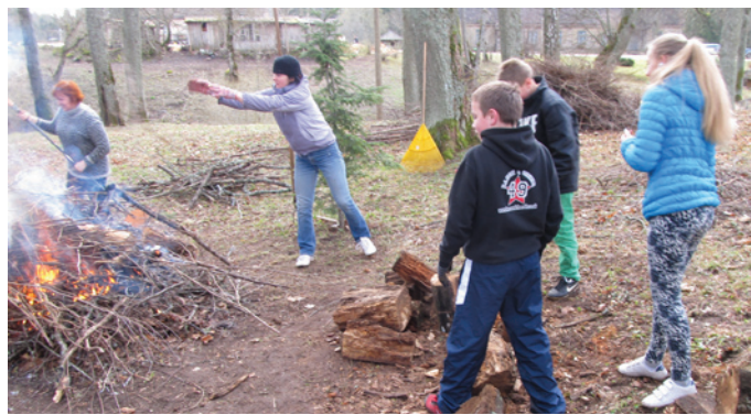
Patīkami bija redzēt smaidošus, strādīgus skolēnus, kas rada prieku darba procesā

Šīs četras dienas pierādīja, ka kopīgi varam paveikt daudz. „Bijām strādīgi un čakli, inteliģenti, draudzīgi, iejūtīgi, aizrautīgi. Šīs dienas bija