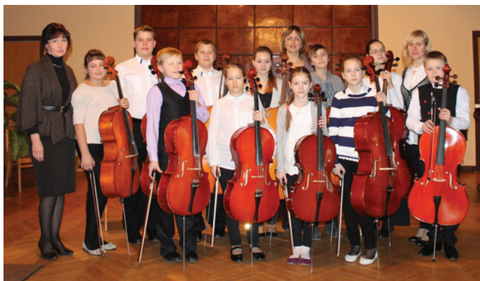
Prieks par jauniešiem, kuri izglītojas mūzikā un gūst panākumus. Paldies skolotājiem!

Daudz pūļu jāiegulda, lai radītu audzēkņos motivāciju regulāram darbam. Tajā brīdī, kad audzēkņi saprot, ka ceļš uz meistarību ir ne tikai