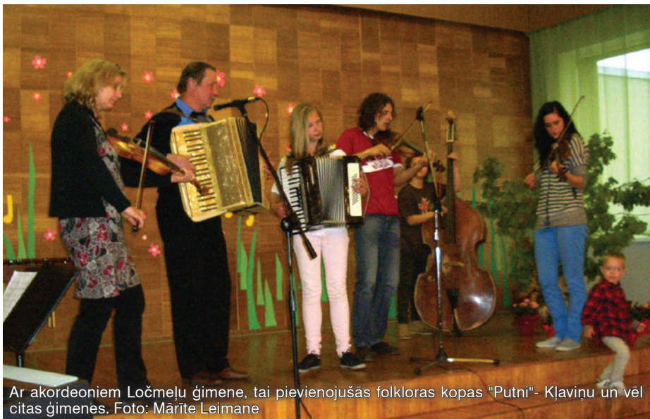
Ar akordeoniem Ločmeļu ģimene, tai pievienojušās folkloras kopas "Putni"- Kļaviņu un vēl citas ģimenes.

Šogad Lēdurgā otro gadu Mātes dienas koncertā dziedāja un spēlēja Lēdurgas ģimenes. Šī iecere radās pirms kāda laika, kad TV ekrānā ar prieku skatījos Dziedošo ģimeņu šovu. No sirds jutu līdzīgu ģimenēm, sevišķi tām, kuras pazinu, jo katrā sezonā šovā dziedāja man ļoti zināmas ģimenes. Pagājušajā gadā, tuvojoties Mātes dienai, uzrunāju dziedošos lēdurdziesus, kuri piekrita dziedāt koncertā „Visskaistākās no visām dziesmām ir tās, ko mātes bērniem dzied”. Ar sajūsmu skatītāji klausījās košo Sebru, atraktīvo Bērziņu, tautisko Kļaviņu-Ābeļu ģimeni un jautro Mazureviču-Mottes ģimenes! Pēc koncerta bija skaidrs, ka tradīciju turpināšu un, kamēr strādāšu Lēdurgas kultūras namā, Mātes dienas koncertos vienmēr dziedās mūsu pašu ģimenes!