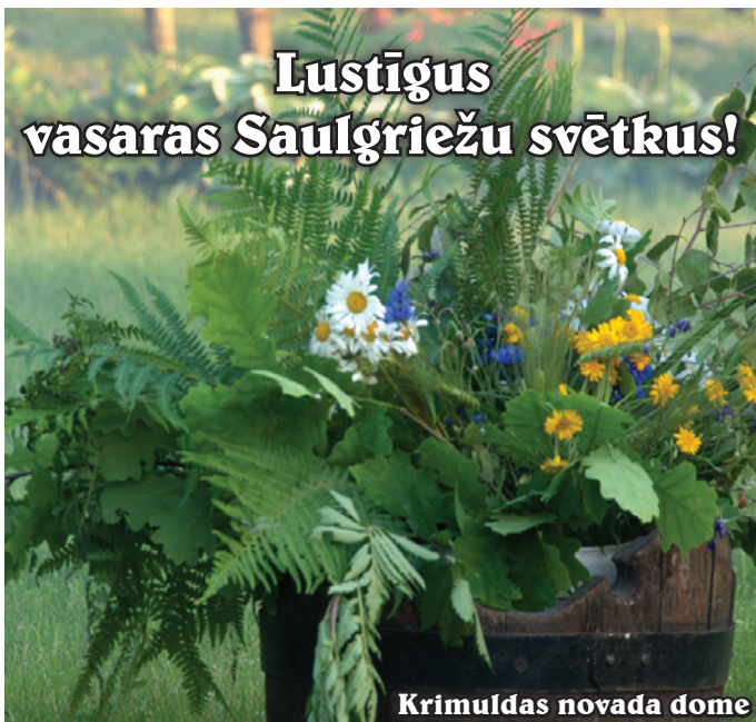
Krimuldas novada dome