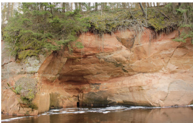
Krauja iezis (Braslas upe)