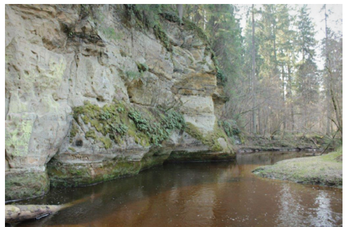
Loreleja jeb Ziedoņa iedvesmas vieta Murjānos (Lojas upe)