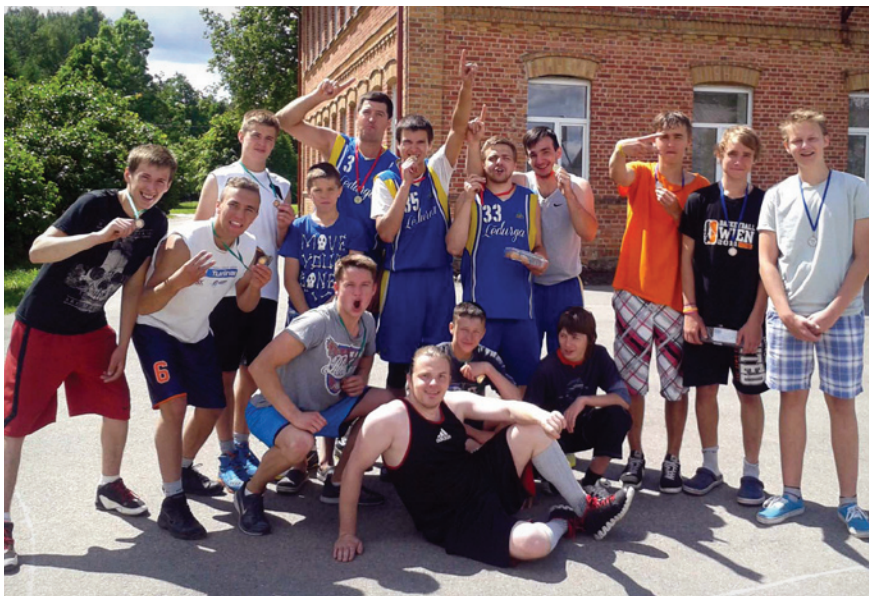
Spēles bija interesantas un aizraujošas

14. jūnijā Lēdurgā notika turnīrs strītbolā .