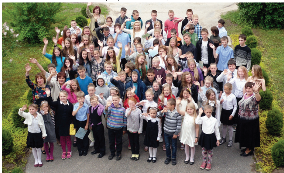
Sveiciens novadniekiem un vasarai!

22. maijā interesenti varēja tikt ar aktri-