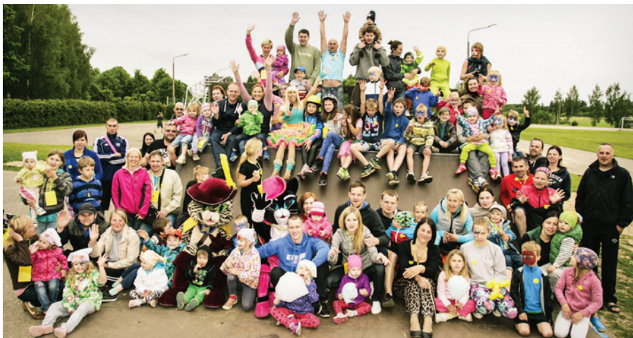
Visiem aktīvajiem novadniekiem vēlam skaistu vasaru!