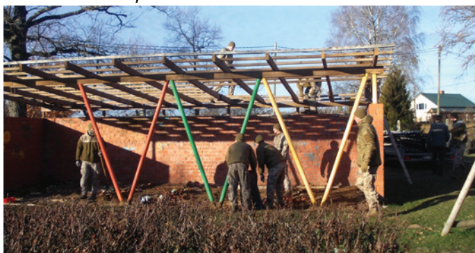
Kopīgi tika nojaukta novecojusī nojume

Ar maziem soliņiem, bet uz priekšu Lēdurgas bērnodārzā tiek sakārtota vide.