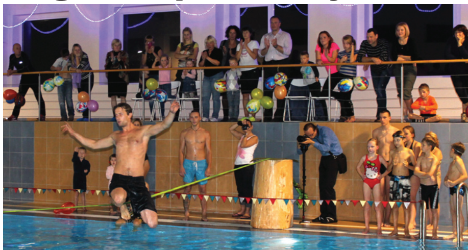
Veselības dienā klātesošo interesi izraisīja priekšnesums- līdzsvara izaicinājums virs ūdens

kušie rīdzinieki teica, ka tikko apmeklējuši SPA Rīgā, kur, samaksājot par apmeklējumu 14 eiro, piedāvājums nav bijis tik patīkams, kāds mums ir šeit - Raganā.