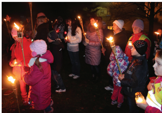
Lēdurgā. Lāpu un sveču gaisma, lai atspīd acīs un sirdīs