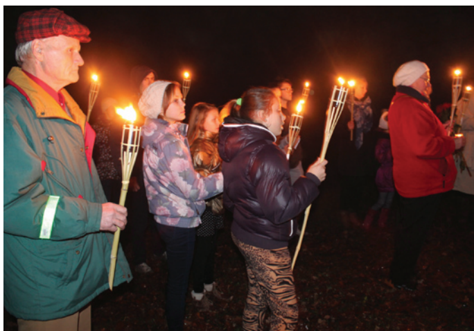
Raganā. Par Latviju! Par mūsu Tēvu zemi, par Krimuldas novadu!