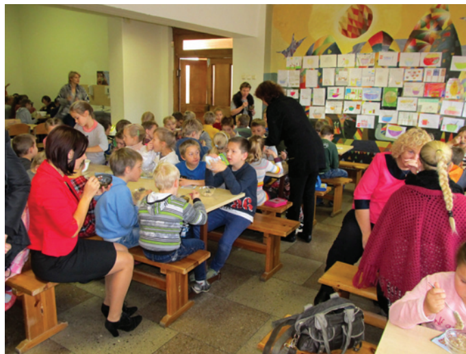
Putras dienā dūšīgi ēdām putras, kuras sagādāja Rīgas Dzirnavnīeks

Katrs no nosauktajiem skolotājiem piedāvāja un realizēja savas idejas nedēļas sekmīgai norisei: 5. klase risināja skaitļu rēbusus, 6. un 7. klase minēja krustskaitļu mīklas un veidoja stereometriskas figūras, 8. klases ķīmijā veica laboratorijas darbu "Ziloņu zobu pasta", preparēja plastilīna vārdes, piedalījās konkursā „Vai esi gudrāks par sākumskolas skolēnu?”, 9. klase risināja dažādus atjautības uzdevumus matemātikā, noteica cukura līmeni organiskās vielās, fizikā noteica apgaismojuma pietiekamību skolas telpās un trokšņa fonu skolas telpās, 10. klase, līdzīgi kā 6. klase, veidoja stereometriskas figūras no papīra, ķīmijā gatavoja šķīdumus pēc molārās koncentrācijas, fizikā veica pētniecisko darbu par paātrinājuma atkarību no masas, 11. klase arī pārliecinājās, vai ir gudrāki par sākumskolas skolēniem un piedalījās diskusijā "Dabaszinātņu vieta visu zinātņu pasaulē", bet 12. klase pārbaudīja spēkus sudoku risināšanā un klausījās lekciju internetā "Visuma bezgalība – kā tas ir iespējams?".