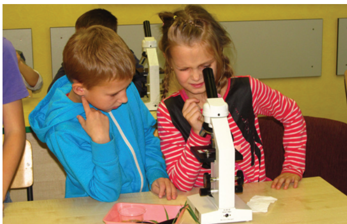
Darbs ar mikroskopu vienmēr ir aizraujošs un atklājumiem pilns