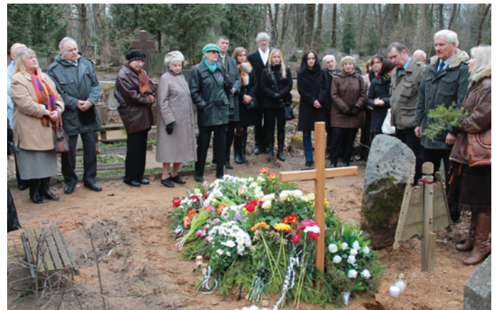
9. martā pie Maijas Pīlāgas atdusas vietas viņas tuvinieki un personas cienītāji

◆ Apņēmību un darbību varam mācīties no Maijas. Lēdurgas mākslas