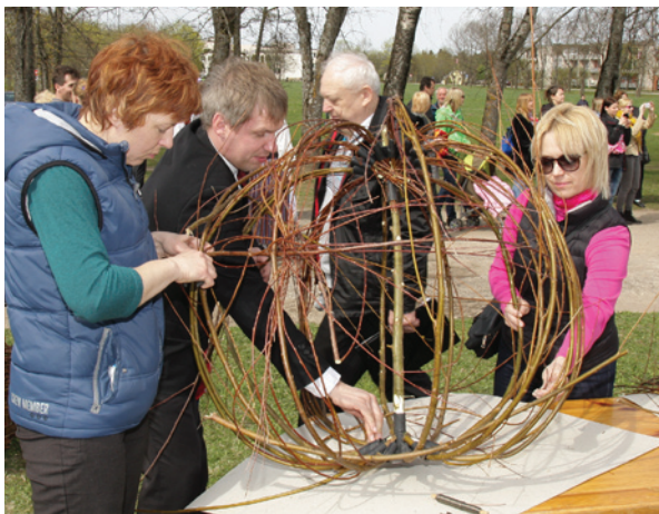
Mākslas dienā „Krimuldas pavasaris” top Krimuldas novada ģerboņa simbols- zelta ābols