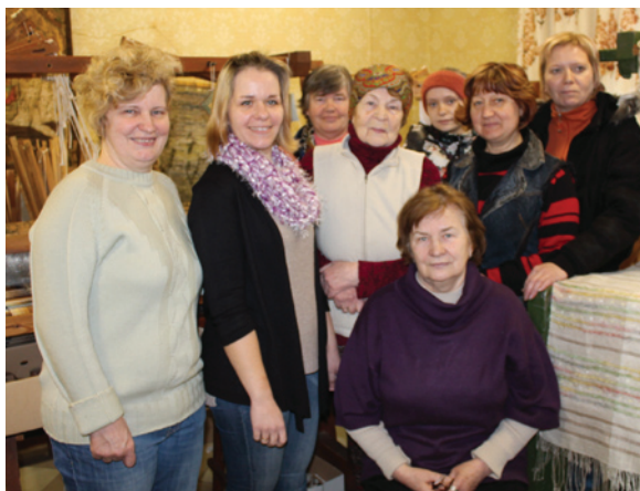
TLMS „Krimulda” pārstāves un viešņas akcijas „Satiec savu meistarumu!” dienā