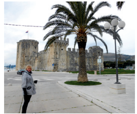
Leģendārais Kamerlengas cietoksnis nekad netika ieņemts ar kauju, bet to „ieņēma” vīru koris „Vecie draugi” un draugi no „Imantas”- ar dziesmu...

Savukārt no brīviem kora dziedājumiem man šķiet visilgāk atmiņā paliks mūsu dziedājums Kamerlengo fortā, kur kā ievērojams tūristu objekts ir svētā Marka tornis.