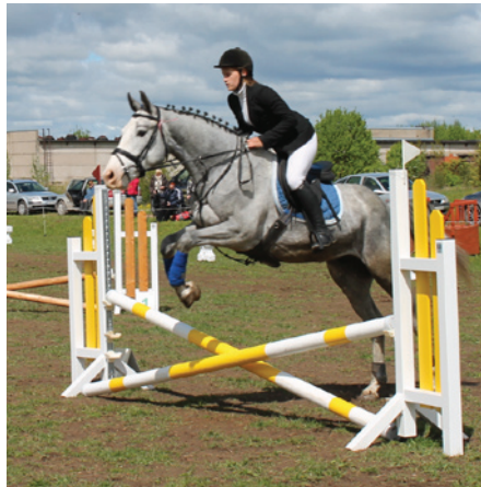
16. maijā notika jāšanas sporta sacensības Eikažos

Viktorijas klubs veiksmīgi apguvis Eiropas Savienības piedāvāto projektu finansējumu iespējas. Tā rezultātā sacensībās jau-