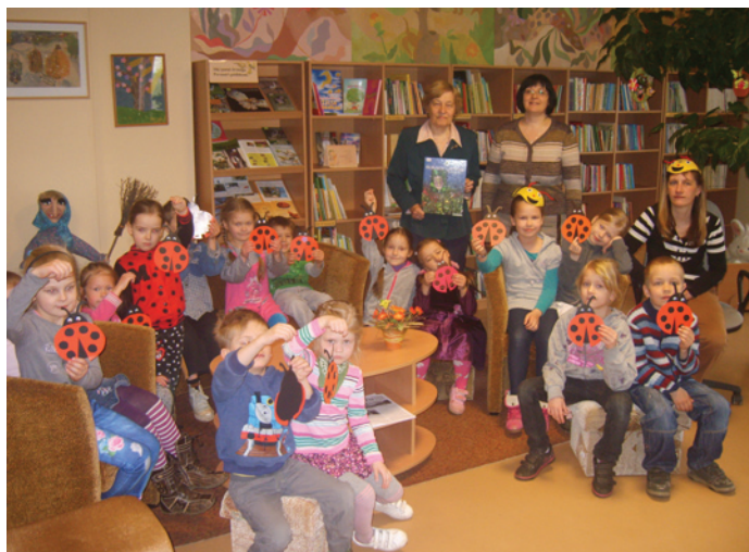
Lēdurgas bērnodarza audzētāji izgatavotās mārītes apmetīsies bibliotēkas lielajā puķē un pavadīs tur visu vasaru