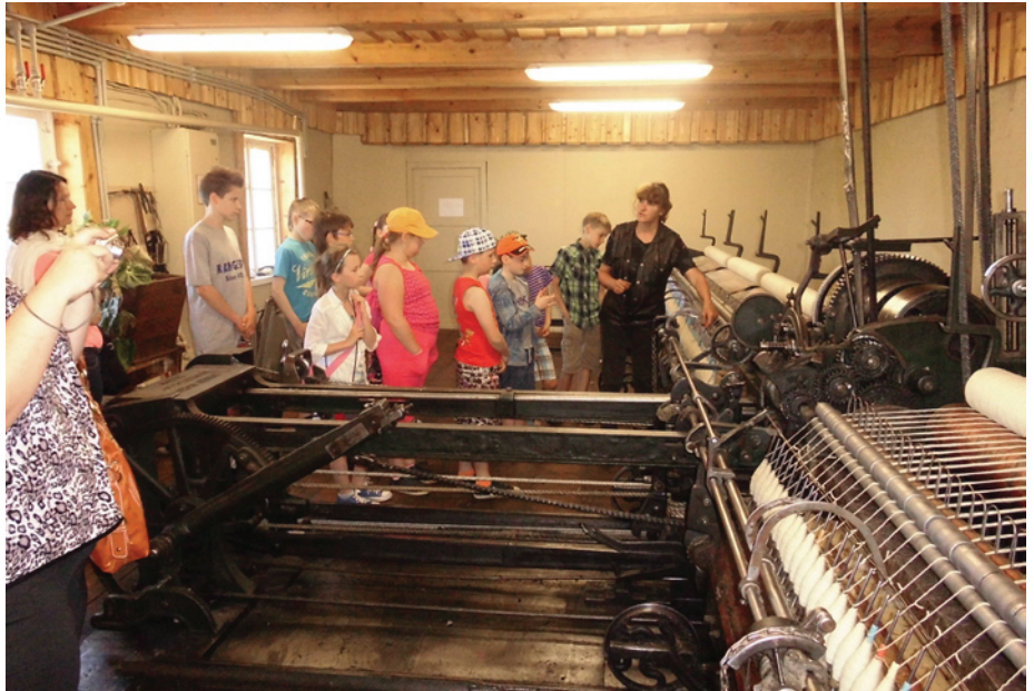
Iepazīšanās ar senajām iekārtām Ķonu dzirnavās

Par tradīciju jau ir izveidojusies ikgadējā lasītāju ekskursija. Sirdī ielīst mīļums, atceroties tautā iemīļoto Kārļa Skalbes pasaku „Kaķīša dzirnavas”, kas ļaudīm māca, nevis naidoties, bet saprast citam citu, atbalstīt un palīdzēt. Nolēmām apmeklēt 150 gadu vecās Ķonu dzirnavas. Ieejot dzirnavu priekšnamā, mūs tiešām sagaidīja divi kaķi. Te vēl joprojām darbojas dzirnavu ganģi, uz vecām kāršamajām un vērjamajām iekārtām tiek demonstrēts, kā no aitu vilnas pakāpeniski top gludi dzijas kamoli, kā arī