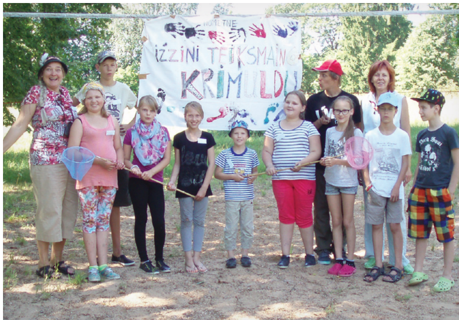
Nometnes "Iepazīsti savu teiksmaino Krimuldu" pedagogi un dalībnieki

Vide mūsu novadā ir daudzveidīga un savā ziņā unikāla. Par to varēja pārliecināties nometnes laikā, trīs dienas dzīvojot teltīs, pašā dabas viducī – Turaidā. Nometnes laikā dalībniekiem tika dota iespēja nepastarpināti apgūt dzīvo vidi veicot pētījumus dabā un darbojoties dažādās darbnīcās ar dabas materiāliem, tādejādi saņemot informāciju un prasmes, kas veido atbildīgu attieksmi pret vidi kopumā un savu darbību tajā. Interese par vidi nometnes dalībniekos tika veidota gan praktiski darbojoties, gan novērojot un analizējot vēroto, gan kopā aplūkojot dažādas teorijas un modeļus, gan uz vietas pārbaudot praksē aplūkotās teorijas un novērtējot, vai tās darbojas vai ne. Patiess gandarījums par to, ka vides pētniecības nometne ir izdevusies, un skolēni atgriezušies mājās ar dziļāku izpratni par ekosistēmu daudzveidīgo nozīmi.