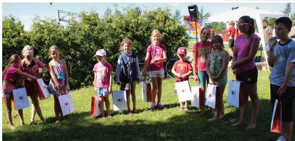
Sporta svētkos uzvarētāji bērnu konkurencē.

Spēka vingrinājumu pārbaudījumus palīdzēja veikt Krimuldas atlēti.