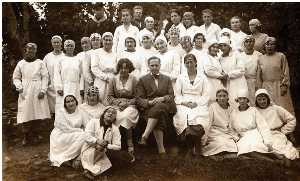
Englārtes konfekšu fabrikas darbinieki ar īpašnieku Klotu centrā. 20.gs. 30.gadi