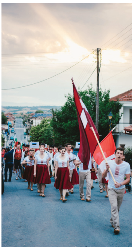
“aPerto” parādes gājiēnā devās ar Latvijas karogu un dziesmu “Bēdu, manu lielu bēdu”