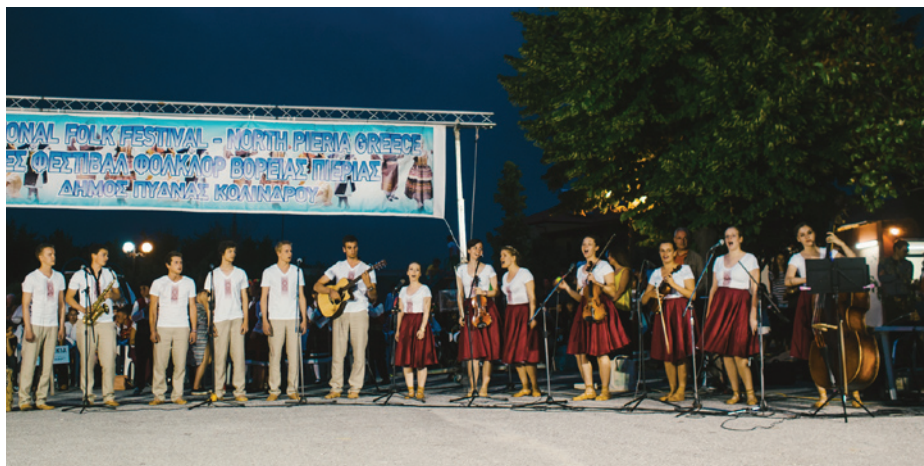
Gandarījums uzstājoties festivālā

Grieķija atmiņā visiem paliks ar skaistajiem dabas skatiem, kurus varēja apskatīt pastaigā pa Grieķijas Olimpa kalna takām. Katrs no šī gājiena varēja atrast par ko priecāties – cits par sastaptajām dabas vēltēm (meža zemenēm, piparmētrām), cits par kalnu ainavām, cits pārliecinājās par savu