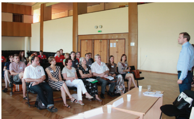
Jauno zinātnieku apvienības vasaras nometnes viesus un dalībniekus sveic Krimuldas novada domes priekšsēdētāja vietnieks L.Kumskis.

Šogad Latvijas Jauno zinātnieku apvienības (LJZA) nu jau par tradīciju kļuvušās vasaras nometnes tēma bija „Pārdod zinātni”. Jau sesto gadu šāda nometne notiek Lēdurgā, un otro gadu tās viesu vidū ir Latvijas Zinātņu akadēmijas (LZA) un Latvijas Zinātnes padomes (LZP) pārstāvji. Pasākumu atbalsta Krimuldas novada pašvaldība.