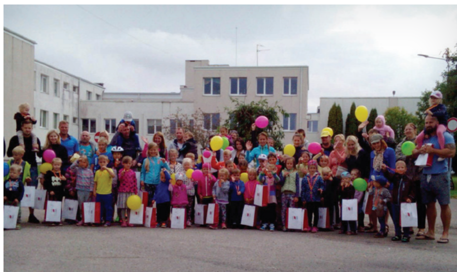
Paldies organizētājiem, paldies dalībniekiem un viņu vecākiem, paldies tiesnešiem!

Uzskatu, ka šāda veida sacensībām mūsu novadā jānotiek biežāk, jo bērni ir aktīvi un