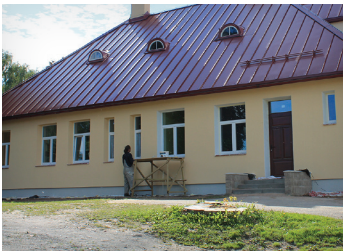
Ambulances ēkas krāsošanas darbi gandrīz pabeigti

Krimuldas novada pašvaldības SIA “Krimuldas doktorāts” Raganā piedzīvojis pamatīgus ēkas ārpusē būvdarbus.