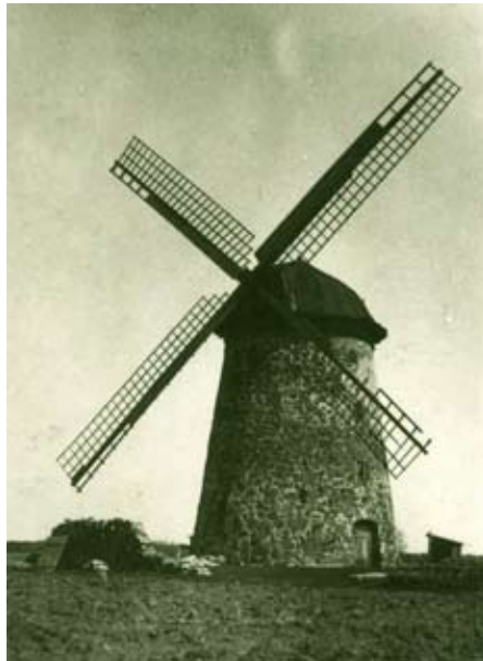
Aijažu muižas vējdzirnavas Lēdurgas-Limbažu ceļa malā. 20. gs. 20. gadi.

rāda, ka muižā tam visam klāt bija uzceltas arī vējdzirnavas.