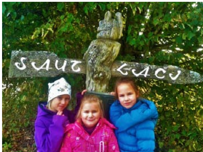
Ciemos zemnieku saimniecībā “Saulāči”

Oktobra sākumā bija svētki skolotājiem. 9. kl. skolēni bija parūpējušies, lai šī diena būtu īpašāka kā citas. Bija gan pārsteigumi, gan sveicieni skolotājiem. Pēcpusdienā skolotāji devās pieredzes braucienā uz Siguldas bērnudārzu-ekoskolu “Ieviņa”. Saulainajā piektdienas novakarē vēl skolotājus priecēja Sigulda un tās daba.