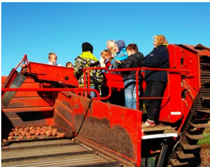
Skolēni piedalījās projektā “Laiks laukiem”