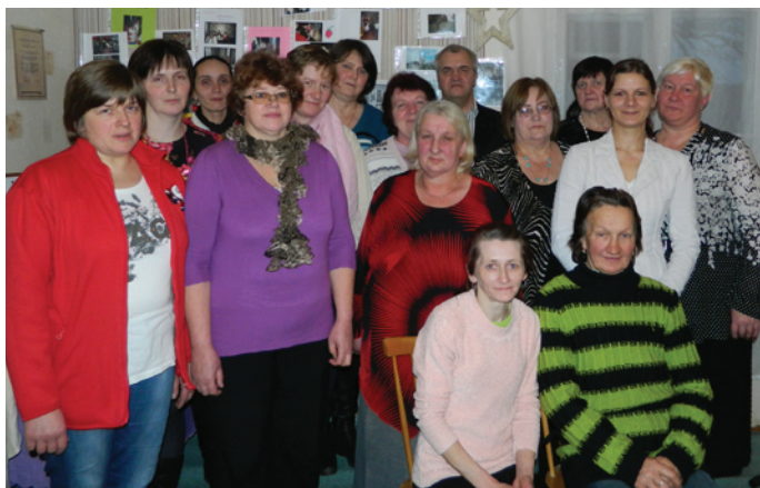
Biedrības dalībnieki vienbalsīgi nolēma, ka darbs ir aktīvi jāturpina

Labdarības biedrībai Ģimeņu Veselības Veicināšanas Centrs (ĢVVC) "Sirdsdegsmē+" aprīlī apritēja 18 gadi. Par godu šim notikumam, 4. decembrī Lēdurgā, "Ārsta mājā" uz salidojumu pulcējās biedrības dibinātāji, vecie un jaunie biedri.