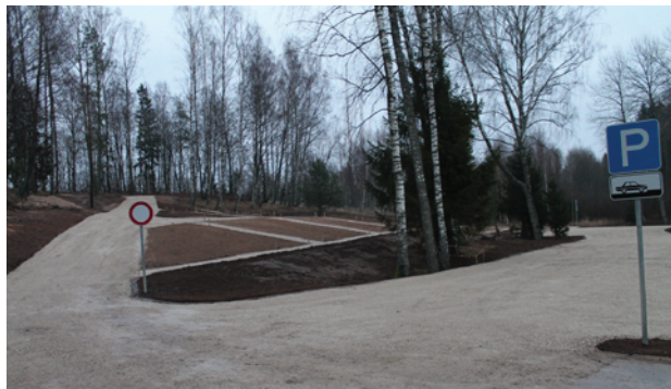
Izveidots piebraucamais ceļš, stāvvietas, vietu iedalījums

◆ Ziemeļu kapu paplašināšanas projekta 1.kārta pabeigta: izveidots piebraucamais ceļš, stāvvietas, vietu iedalījums.