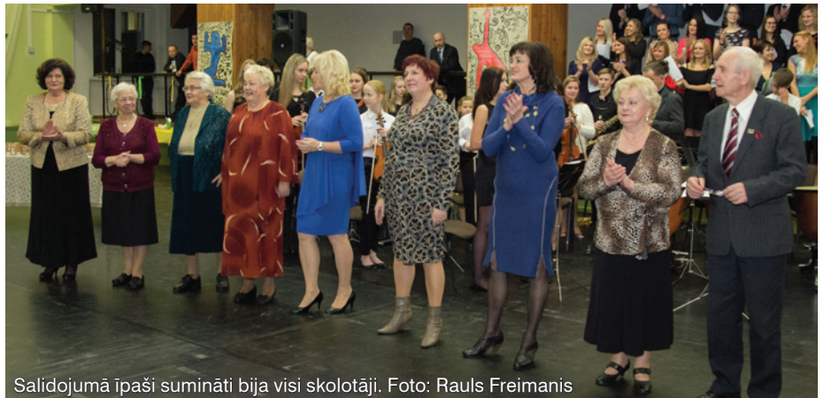
Salidojumā īpaši sumināti bija visi skolotāji.

Gandarījums par šo tikšanos ir milzīgs, jo salidojums ir atkalredzēšanās svētki, kopā sanākšanas svētki. Pozitīvās emocijas, smaidi, prieks par ikvienu, kurš ieradies, vēl joprojām virmo skolas telpās un dod mums, pedagogiem, labi padarīta darba atziņu. Tas ir kā dopings līdz nākamajiem kopā sanākšanas svētkiem.