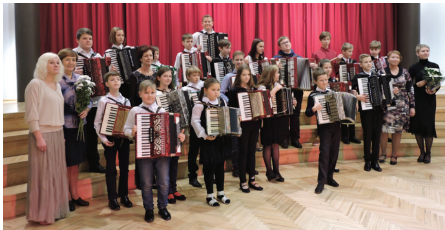
Akordeona spēles pasniedzējas un akordeonisti

Vienoties kopīgā pasākumā bija sanākuši lielie un mazie akordeonisti no Krimuldas MMS, Vidzemes Jūrmalas MMS, Lēdurgas MMS, Babītes MS un Ulbrokas MMS, lai draudzētos ar mūziku, ar klausītājiem un savstarpēji. Uzstājās gan tādi audzēkņi, kuri vēl tikai apgūst akordeona spēli mūzikas skolā, gan arī absolventi, kuri pabeidzot mūzikas skolu, akordeonu nav nolēmuši aizmirstībai. Lai skanējums būtu vēl krāsaināks, lielajam akordeonistu pulkam pievienojās draugi, kuri spēlē čellus, saksofonu, bungas un klavieres. Krimuldas un Vidzemes Jūrmalas MMS audzēkņu izpildījumā izskanēja gan tautas dziesmas, gan R. Paula "Mēmā dziesmā", "Svētvakars", "Ilgaiss ceļš kāpās". Īpaša uzslava jāvelta pašiem mazākajiem koncerta dalībniekiem, kuri akordeona spēli ir sākuši mācīties tikai šoruden un jau var īsas dziesmiņas nospēlēt koncertā. Skaņdarbus ar valša skaņām, polkas un dažādiem deju ritmiem atveda parādīt Lēdurgas, Babītes un Ulbrokas draugi. Mazie pirksti ņirbēt ņirbēja pa akordeona