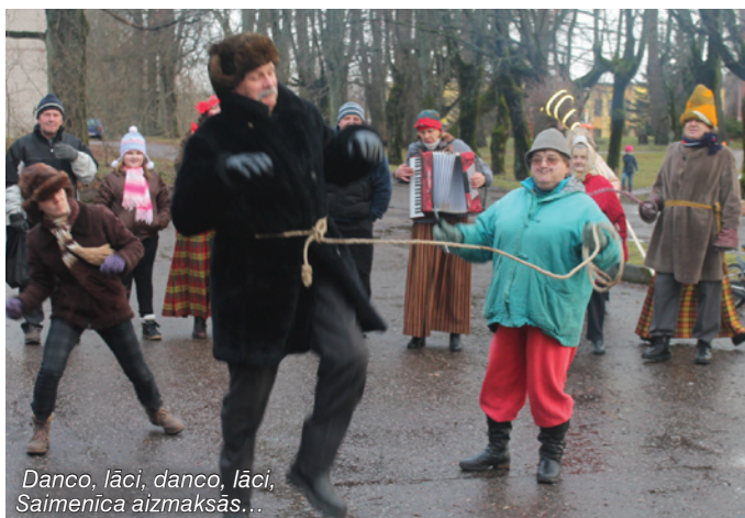
Danco, lāci, danco, lāci, Saimenīca aizmaksās...